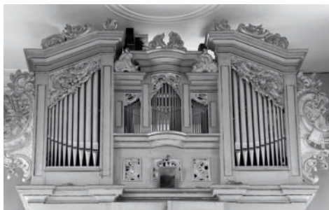
Orgel in Oelknitz